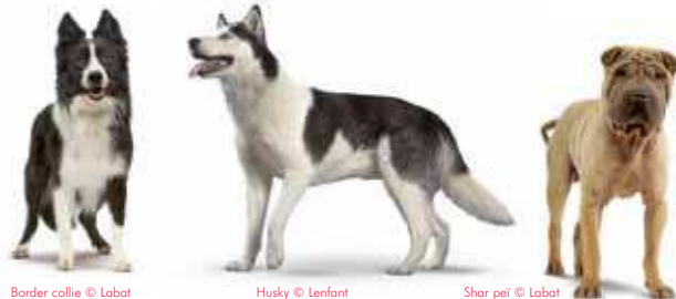
Border collie

[ pasterskie - zaprzęgowe - stróżujące ]