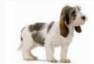
Petit Basset Griffon Vendéen