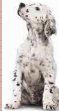
Seter angielski © Lenfant