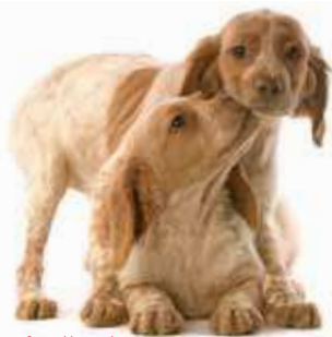
Spaniel bretoński

Wiedziony instynktem, chroniony przez Zdrowe Żywienie