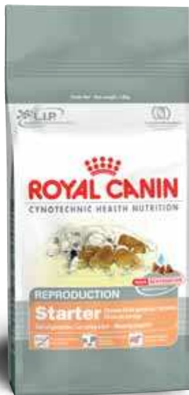
Opakowania 2 kg, 10 kg

Suki: w okresie ciąży (od 42 dnia ciąży) i laktacji Szczenięta: w okresie odsadzania (od 3 do 7 tygodnia życia)