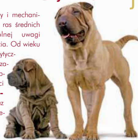
Shar pei

Układ odpornościowy i mechanizmy ochronne psów ras średnich wymagają szczególnej uwagi na każdym etapie życia. Od wieku szczenięcego i krytycznego okresu odsadzenia, poprzez silne obciążenia odporności aktywnych psów do-rostłych , aż po coraz bardziej osłabione wiekiem psy starsze.